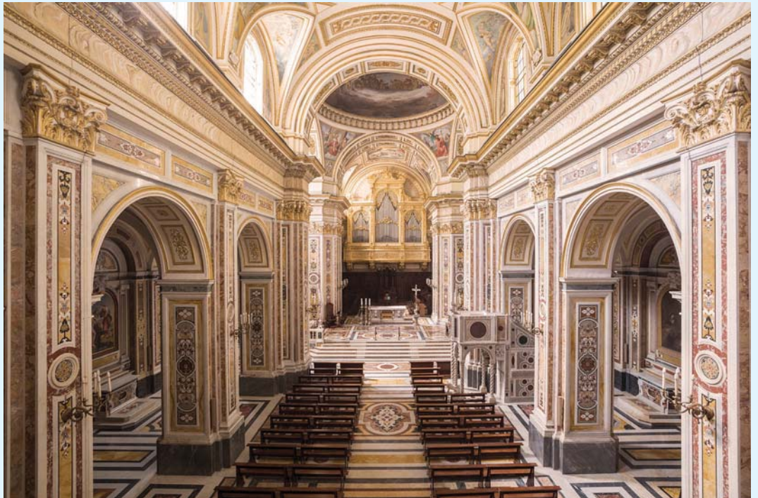
Interno della Basilica Cattedrale della Badia