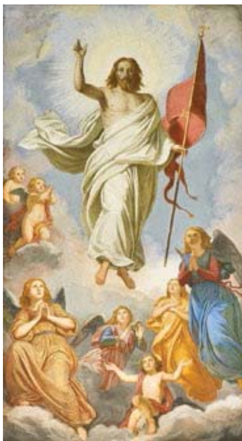
VINCENZO MORANI, Risurrezione , sec. XIX, Badia di Cava, Cattedrale

Le conseguenze stanno sotto gli occhi: sfiducia nella vita e nel futuro, sfaldamento della convivenza sociale e familiare. Forse siamo