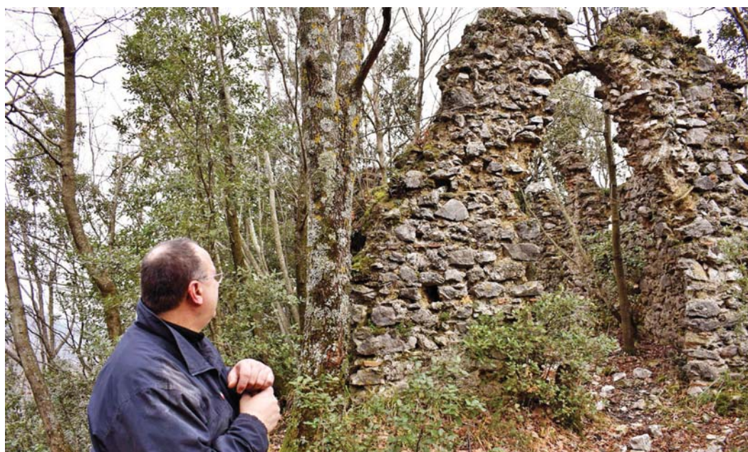
Il P. Abate ammira quella che fu una chiesetta sul monte S. Elia