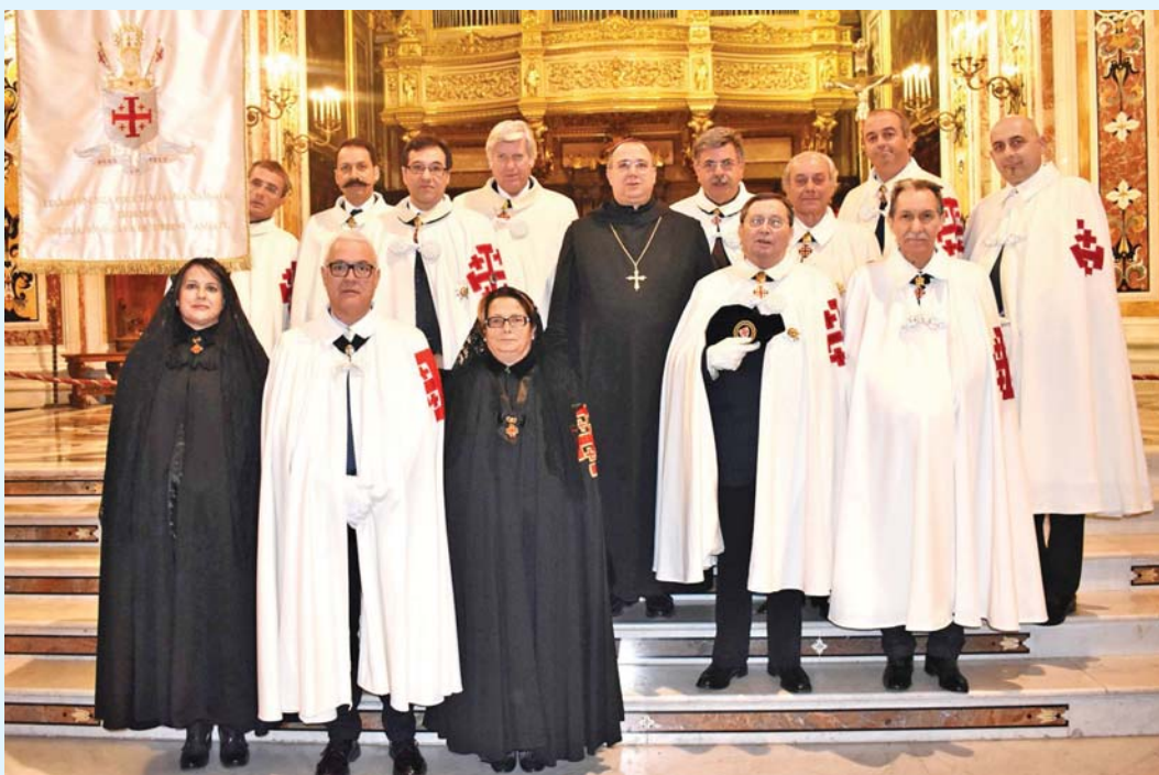
Cavalieri e Dame del Santo Sepolcro riuniti alla Badia

31 gennaio – Al mattino si vede la neve sulle montagne a ovest della Badia, come monte Finestra e monte Spagnolo.