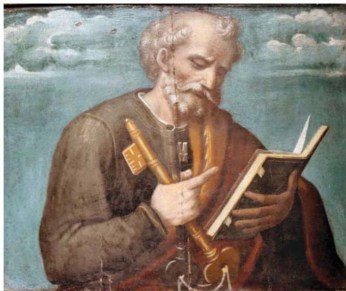
S. Pietro, tempera su tavola, XVI sec., Museo della Badia di Cava

- Anche tu, che sei stato il primo, quello che mi fece sperare di più, il più duro ma il più infocabile, il più ignorante ma il più fervente, anche tu, Simone, quello stesso che gridasti presso Cesarea il mio vero nome, anche tu che conosci tutte le mie parole e mi hai baciato tante volte con quella stessa bocca che dice di non conoscermi, anche tu Simon Pietra, figlio di Giona, mi rinneghi in faccia a quelli che si preparano a uccidermi! Avevo ragione, quel giorno, di chiamarti intoppo e di rimproverarti che non pensavi