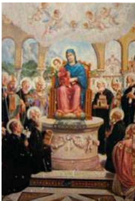
S. Cozzolino sec. XX - Santi Padri Cavensi Badia di Cava

nella stesura di questo numero. Inoltre ringrazio con tutto il cuore per la pazienza e disponibilità dimostrate dal competente tipografo Gaetano Ferrara della Tipografia Tirrena.