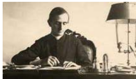
Un giovane Giovanni Battista Montini al suo tavolo di lavoro, nel 1923, alla nunziatura apostolica di Varsavia

«Libertà e obbedienza – sintetizza il presidente dell'Istituto Paolo VI – rappresentano dunque i due atteggiamenti spirituali opposti, che corrispondono al paradosso di una Chiesa depositaria dei misteri divini e, insieme, segnata dal limite e dai fallimenti umani». Paradosso che anche oggi continua a costituire una sfida continua nella vita della Chiesa.